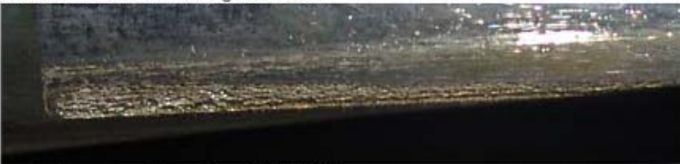
nach der zweiten Behandlung 16.08.2005