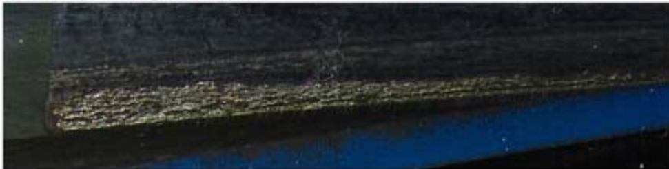
nach der ersten Behandlung 05.07.2005