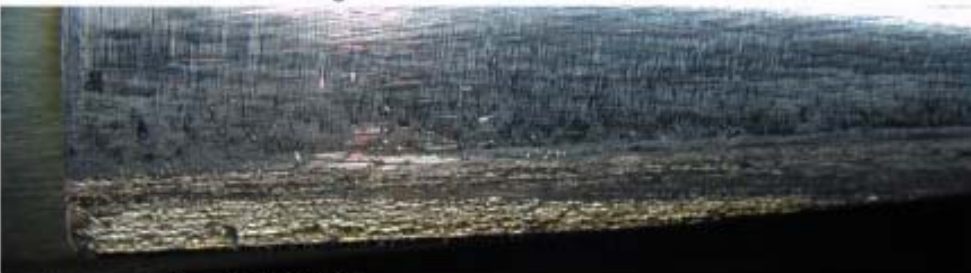
nach dem Ausbau 16.01.2006